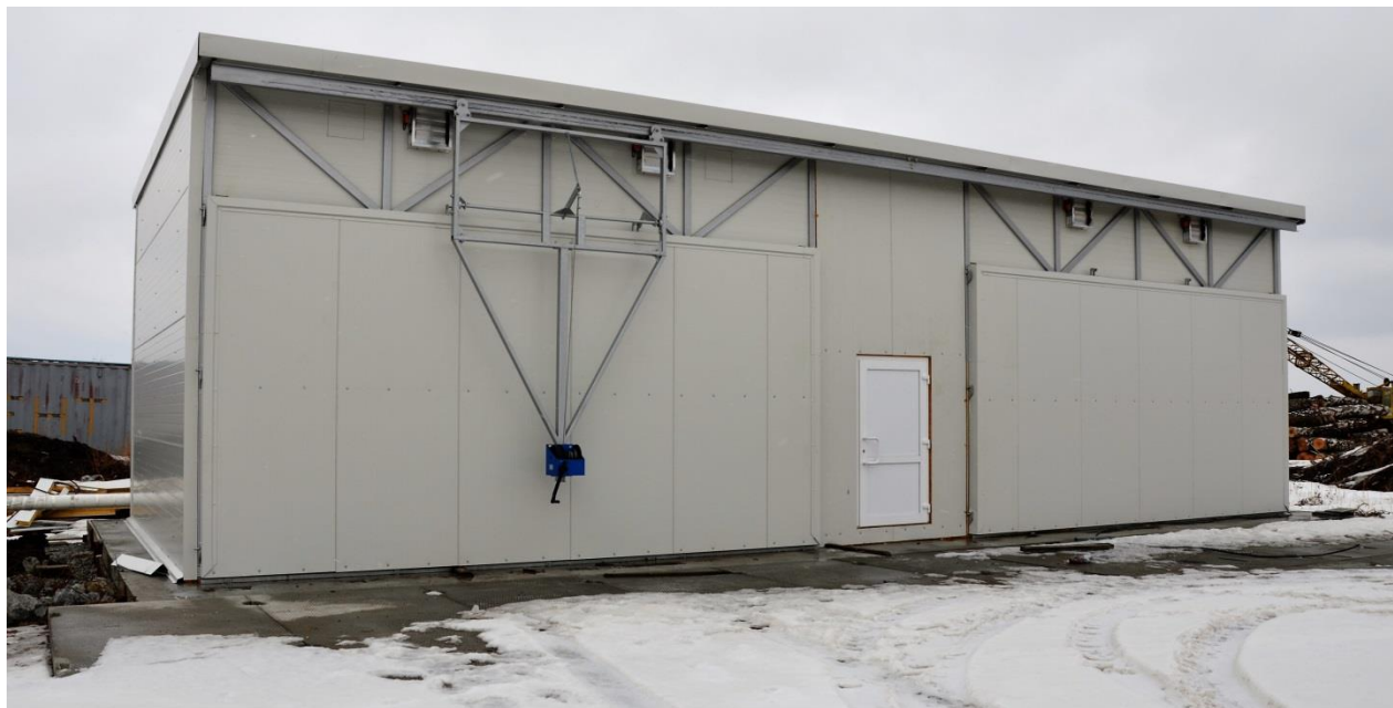
Автоматическая система управления сушильными камерами на базе контроллера LG